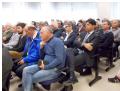
un momento del convegno di Foggia