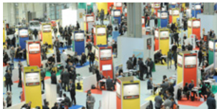
Forum Agenti è la Fiera dei Colloqui di Ricerca Agenti di Commercio

Dalla prima edizione milanese, la Fiera è cresciuta notevolmente: dal 2013 ad oggi sono, infatti, oltre 2.000 le aziende italiane ed estere che hanno scelto Forum Agenti per cercare le figure commerciali più adatte ad ampliare le loro reti di vendita.