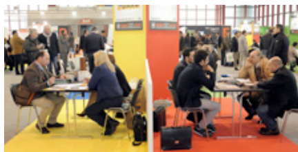
Un momento dei Colloqui di Ricerca Agenti di Commercio a Forum Agenti

Il fulcro di Forum Agenti sono le opportunità di lavoro, i mandati di rappresentanza che le aziende propongono agli Agenti di Commercio. Nelle edizioni passate si sono svolti direttamente in Fiera oltre 50.000 colloqui di Ricerca Agenti complessivi, numero che permette di definire il Forum un moltiplicatore di possibilità di incontro tra domanda e offerta nello specifico contesto della rappresentanza commerciale. Partecipare a Forum Agenti significa, infatti, per gli Agenti di Commercio ottimizzare il tempo dedicato alla ricerca di nuovi mandati e per le aziende ottimizzare i tempi di selezione.