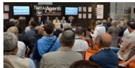
Il convegno Federagenti Cisl durante un'edizione di Forum Agenti

Protagonista del Forum è la figura dell'Agente di Commercio a tutto tondo ed è per questo che la manifestazione è diventata un appuntamento imperdibile per gli «addetti ai lavori» che qui trovano momenti di aggiornamento, confronto e dibattito sui temi inerenti la categoria: come per le precedenti edizioni, anche a Forum Agenti Milano si svolgeranno seminari informativi e di aggiornamento a tema legale e fiscale, mini corsi formativi e motivazionali e convegni di associazioni di categoria; e ancora workshops curati da istituzioni italia-