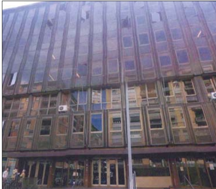
La sede dell'Enasarco

dell'Anasf (associazione che raggruppa i promotori e i consulenti finanziari), ha inviato una lettera..., mettendo in discussione il piano Mercurio per dismettere il patrimonio immobiliare. «In virtù dell'avvio dell'indagine conoscitiva sulla consistenza, gestione e dismissione del patrimonio immobiliare degli enti previdenziali pubblici e privati, deliberata dalla Commissione parlamentare di controllo sull'attività degli enti previdenziali, mi preme esprimerle le forti preoccupazioni di