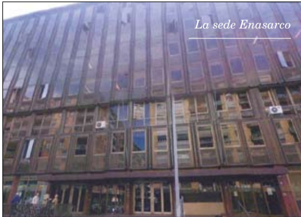
La sede Enasarco